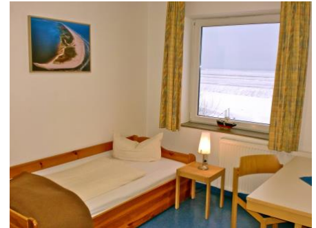
Beispiel Zimmer Dünen- /Deichhaus