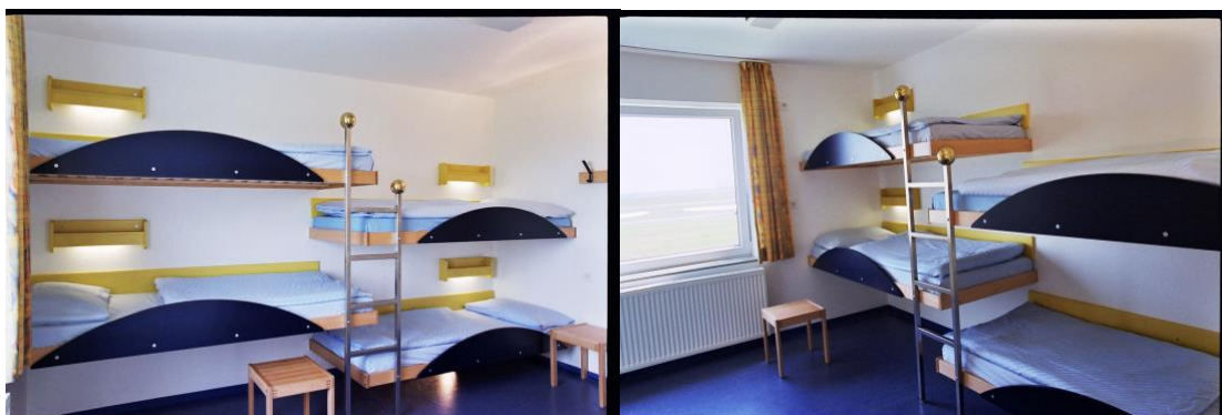
Beispielzimmer Dünenhaus Standard